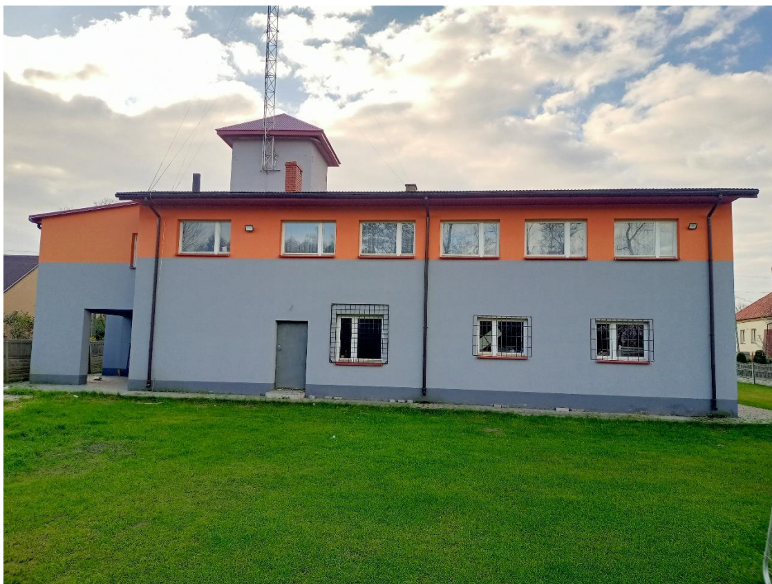
Fot.4 Elewacja tylna inwentaryzowanego budynku