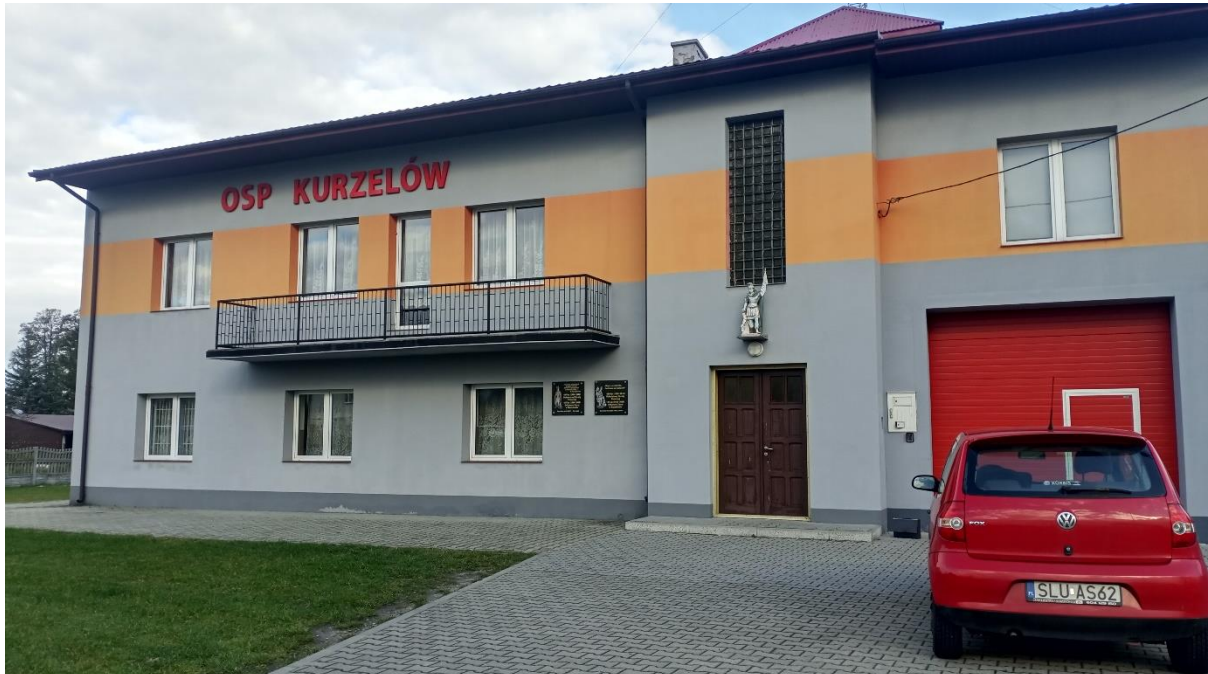
Fot.1 Elewacja frontowa inwentaryzowanego budynku