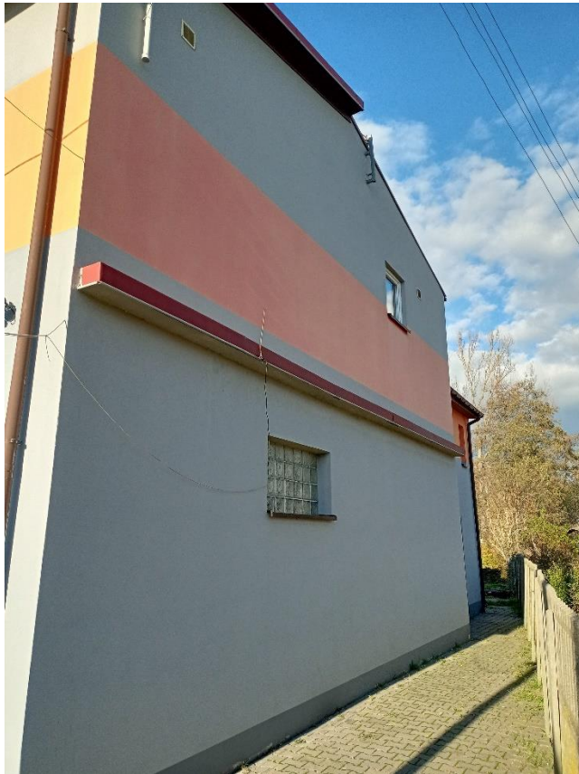
Fot.3 Elewacja boczna inwentaryzowanego budynku