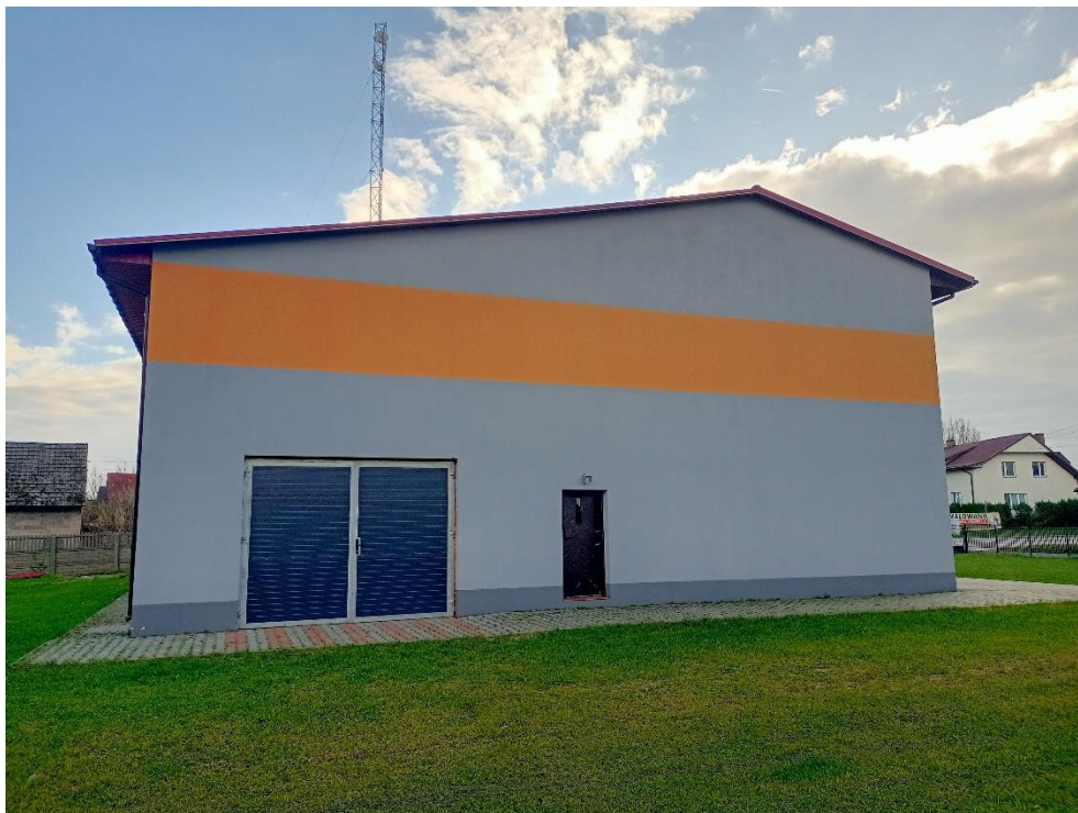
Fot.2 Elewacja boczna inwentaryzowanego budynku